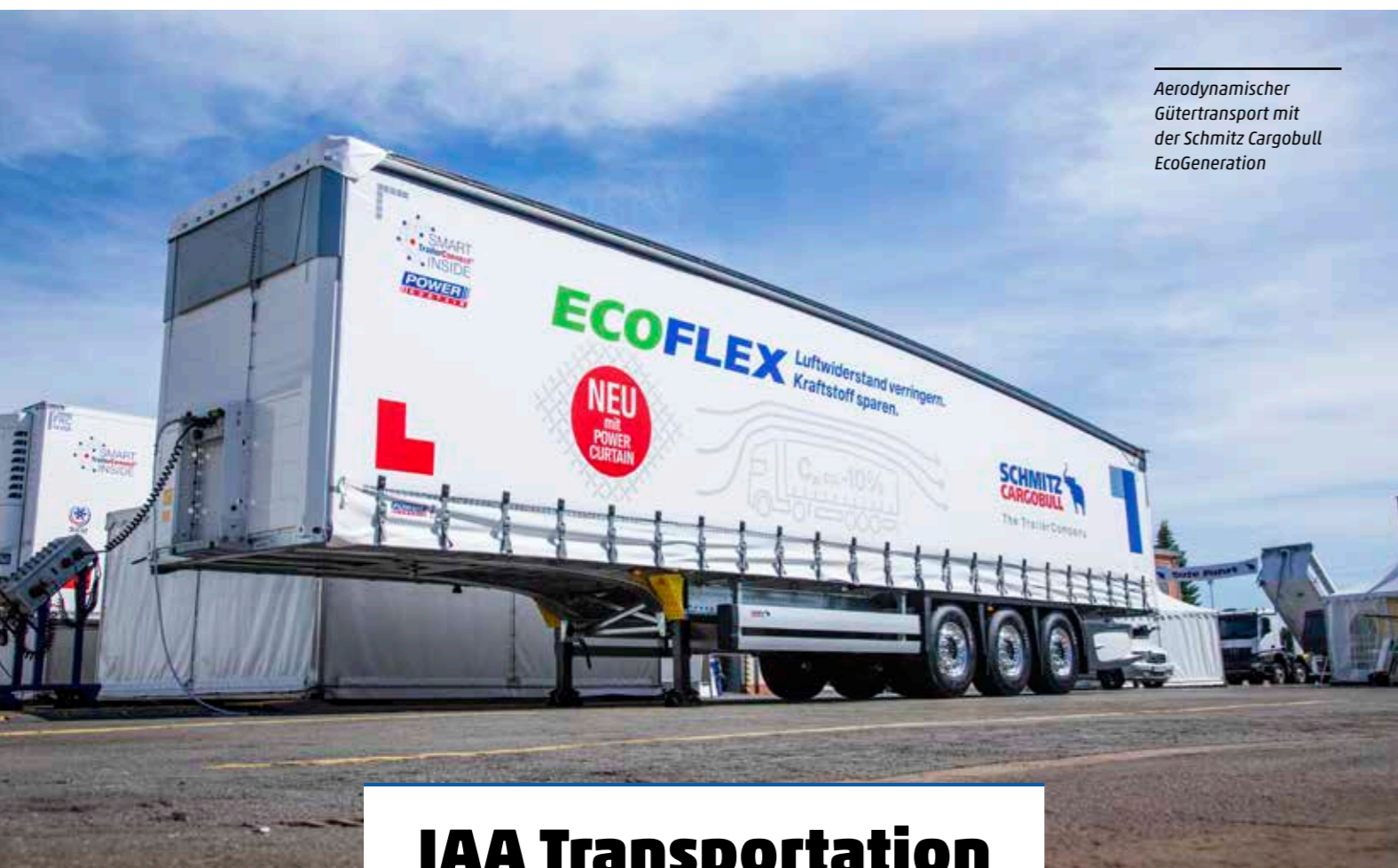
Aerodynamischer Gütertransport mit der Schmitz Cargobull EcoGeneration