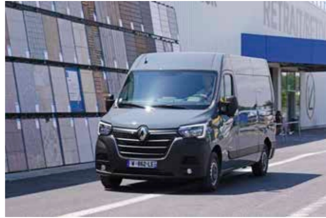
Mehr Batteriekapazität, aber weiter schmale Leistung: Renault Master als Stromer

Fehlt im Programm noch ein Renault Trafic E-Tech Electric. Einen Prototyp präsentierte Renault bereits vor einem Jahr auf dem Caravan-Salon in Düsseldorf – also Geduld, wie bei so vielen Themen in der Automobilbranche zurzeit.